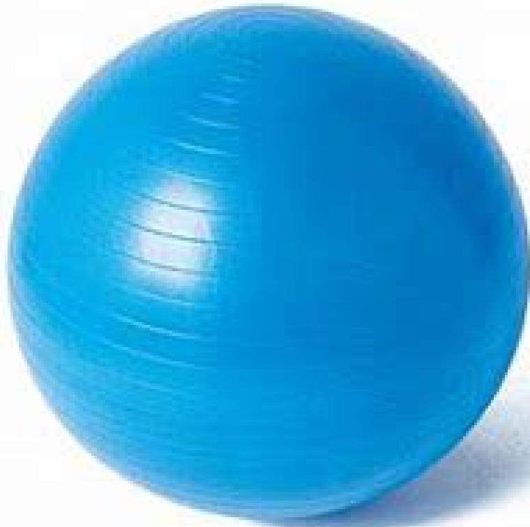
バランスボール 直径55cm

LNGは、天然ガスをマイナス162℃まで冷やして液体にしたもので、「液化天然ガス」とよばれています。液体にすると体積は600分の1になります。