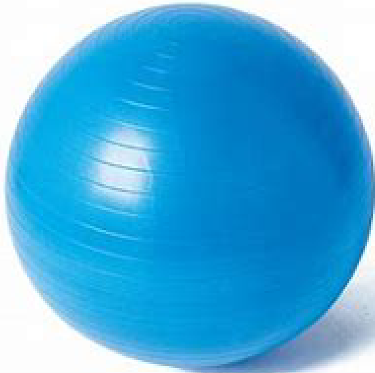
バランスボール 直径55cm

LNGは、天然ガスをマイナス162℃まで冷やして液体にしたもので、「液化天然ガス」とよばれています。液体にすると体積は600分の1になります。